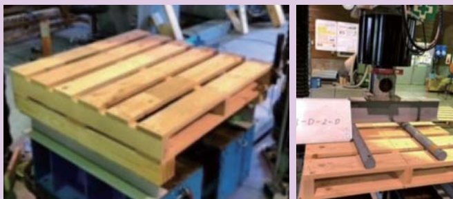
強度試験により性能を確認済

愛媛大学工学部の先生との共同開発で、外材製パレットの強度を超える最小限の部材の寸法を研究により算出し、製造しているため、より強く安価で提供できるパレットとなっています。