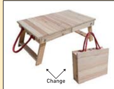
変形ミニテーブル