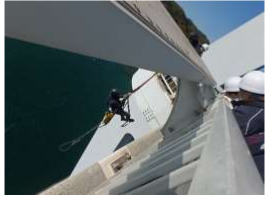
ロープアクセス技術見学