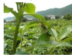
ハマキムシの被害と葉の中の幼虫