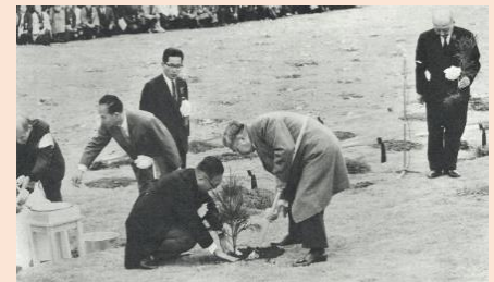
第17回全国植樹祭の様子 (前回の愛媛県開催)

愛媛県では、令和8年春に60年ぶり2回目となる「第76回全国植樹祭」を開催します。