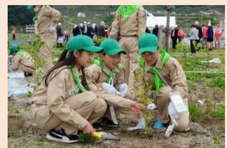
植樹行事の様子

第76回全国植樹祭の植樹行事で使用する「苗木」を育てていただける団体を募集するものです。県内の小中学生等をはじめとする子どもたちに参加していただき、森林の整備や森林資源の循環利用への関心を高めてもらうとともに、全国植樹祭の開催機運を高めていくことを目的として実施します。