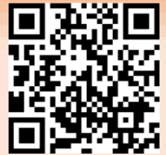
ホームページQRコード

https://www.pref.ehime.jp/page/57560.html