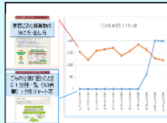
ごみ分別手引きの公開成果

改善活動を体系的に示して職場全体で団結して改善に取り組むこと、実態を見える化し、効果を捉えることが大切である