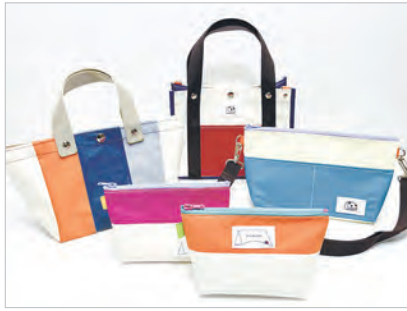
令和5年度認定製品