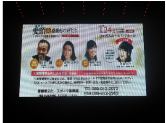
ストリートビジョン