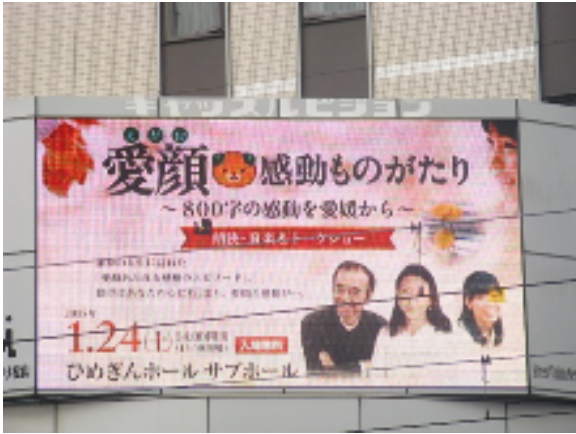
ストリートビジョン