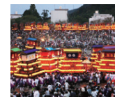
西条市 【西条秋祭り】