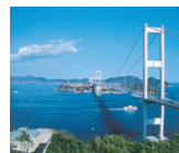
今治市 【しまなみ海道】