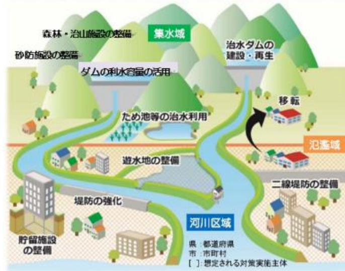
(流域治水プロジェクトイメージ)

河川管理者を含む、あらゆる関係者(国・県・市町・企業・住民等)の協働により流域全体で行う治水「流域治水」へ転換するため、「流域治水プロジェクト」を示し、ハード・ソフト一体となった事前防災対策を加速させ、地域住民の安全・安心の確保を図るものである。