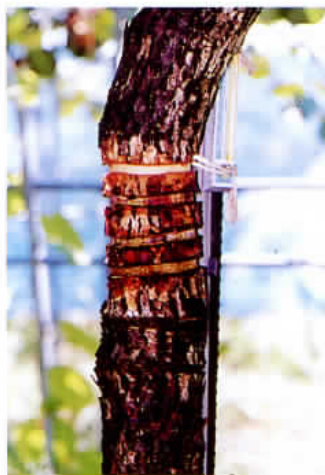
写真1 はく皮処理の状況

一方、処理時期が遅いほど糖度が高くなるので、肥大と品質の両方の向上のためには7月中旬頃から始め、肥大の鈍る8月中旬頃までに完了するように行うのが良い。