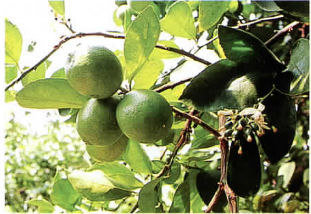
ライムの結実状態

成熟期の落果防止には、果実の横径が2～4cmの時期に50ppmと収穫期の11月中旬に20ppmの2回散布を行うと収穫可能期間を約4ヶ月延長する効果が認められた。また、ライムは果皮の緑色がぬげ黄化すると商品性