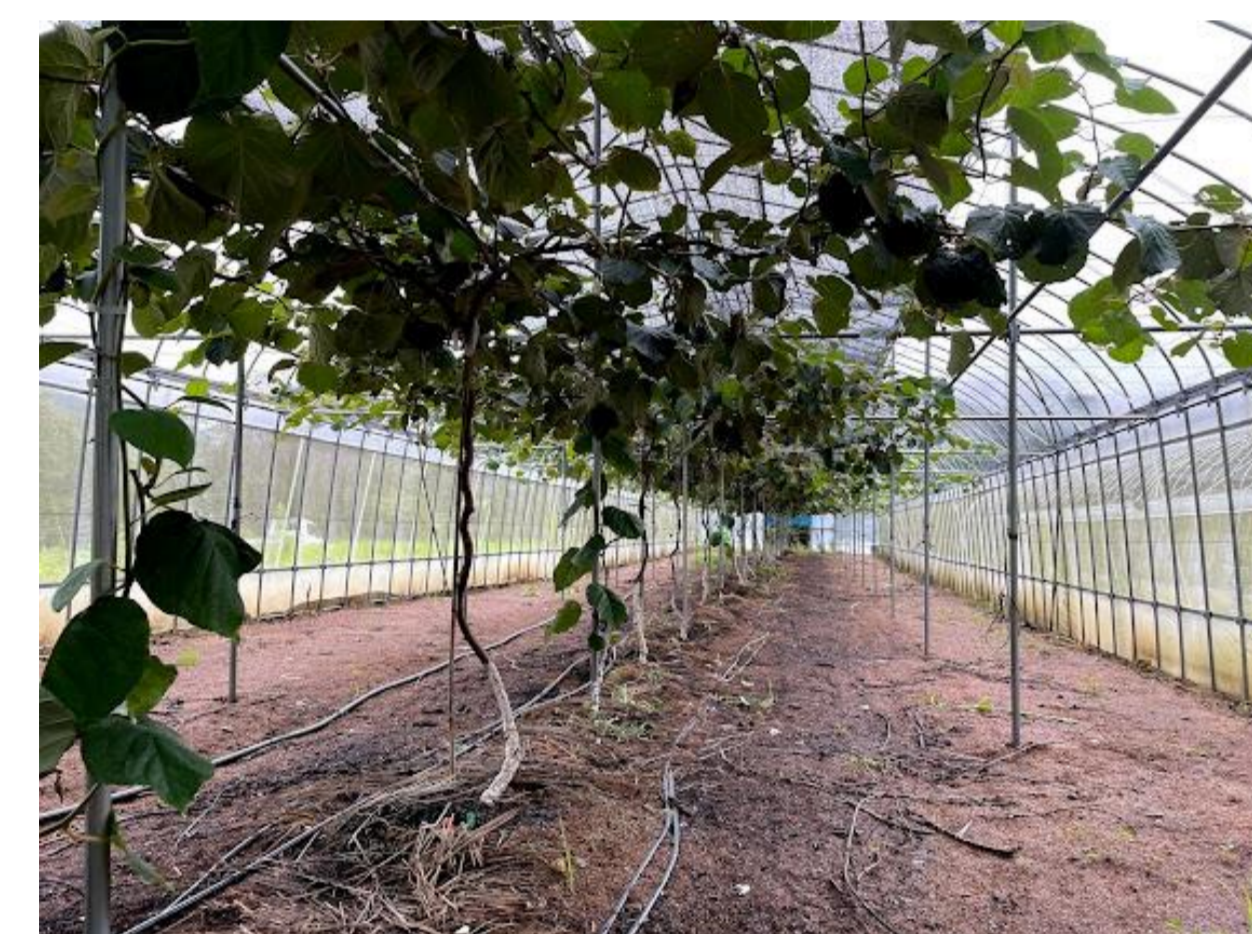
優良品種チーフタンを導入