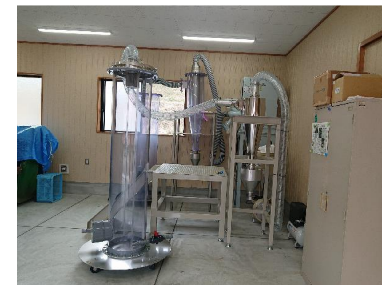
サイクロン式花粉精製機