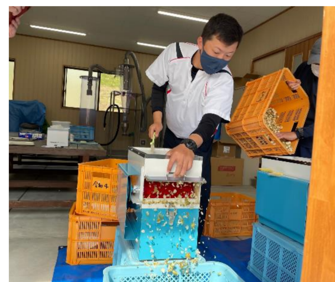
令和4年5月初収穫 試験栽培にサンプル提供