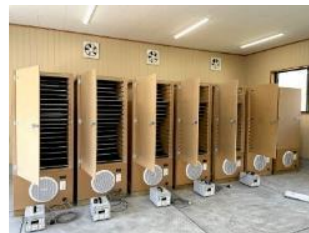
ニュージラント製大型乾燥機