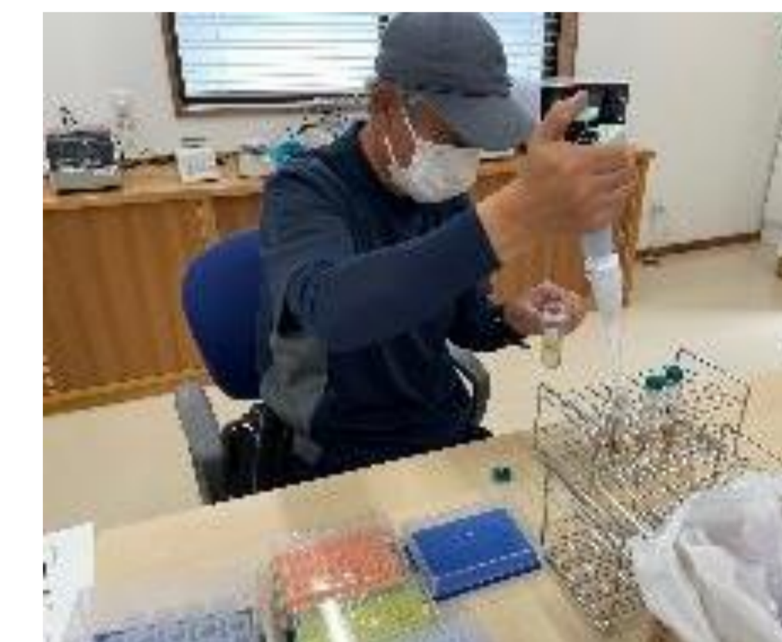
かいよう病遺伝子診断