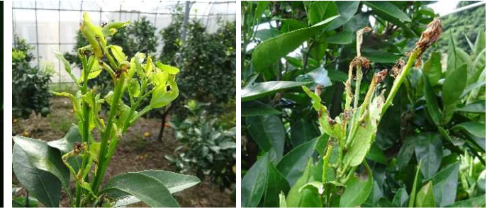
若葉を筒状に巻き込み、その中に潜り込んで食害する。甚だしい場合は新梢が枯死する。