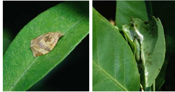
チャノコカクモンハマキ成虫