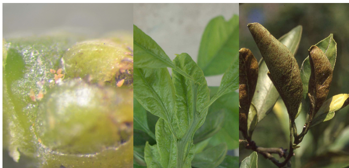
写真2 越冬状況(左)と葉での被害(中、右)

6月や7月の早い時期に加害されると、褐色がかった灰白色の象皮状になり、これ以降では黒褐色から茶褐色の被害となる。