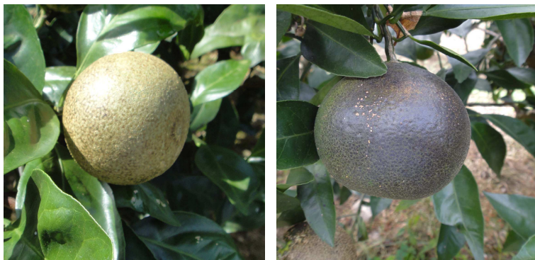
写真1 前期被害(左)と後期被害(右)

6月や7月の早い時期に加害されると、褐色がかった灰白色の象皮状になり、これ以降では黒褐色から茶褐色の被害となる。