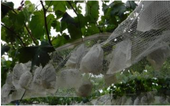
市販品(福友産業株)

マジックテープで固定するため簡単で、強固に設置できる。1本の長さは8mで1人でも5分程度で設置できる。