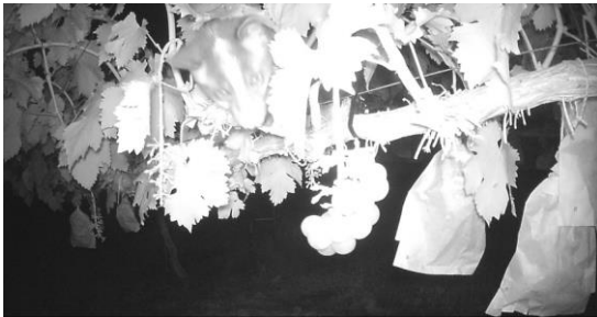
赤外線カメラの映像

赤外線カメラをブドウ園に設置したところ、ハクビシによる被害がほとんどで、日没後数回に分けて出没し、一晩に1匹が2~3房を食害していた。