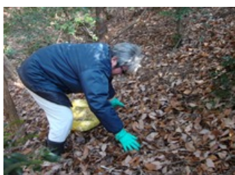
写真1:越冬場所である落葉を採集