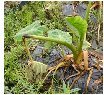
写真2 多発時の葉柄の症状（前年までに確認した症状）