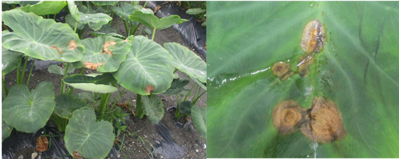
写真1 今回確認した葉の症状（初発）