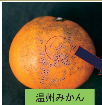
黒点病(初期)の症状

近年、落弁期～梅雨時期に感染する黒点病(前期)による果実の品質低下が認められ、従来の薬剤で対応できない事例が認められる。このため、同時期に防除剤として用いられる防除薬剤の黒点病に対する効果を比較検討した。