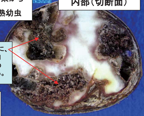
写真5 被害果の内部(切断面)