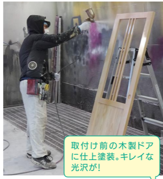
取付け前の木製ドアに仕上塗装。キレイな光沢が!

皆さんが毎日暮らしている住宅や学校、ビルなどの建物を建築する際の最後の仕上げとして、カラーデザインにより美しく、建物を守るため、外壁や内壁への塗装工事を行っています。