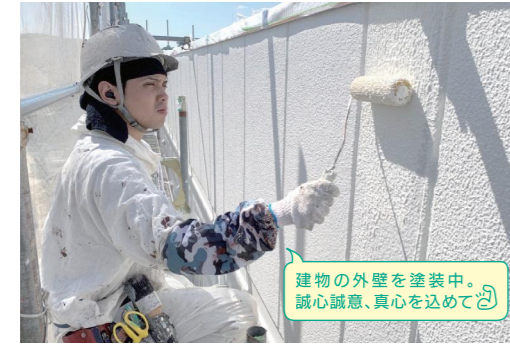
建物の外壁を塗装中。誠心誠意、真心を込めて

塗装の作業は単純に見えますが、とても奥が深く、技術を究めて丁寧にやればやるほど見栄えが良くなり、職人としての責任とやりがいを感じています。