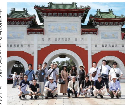
社員旅行やBBQ、スポーツ大会など行事もたくさん開催されており、先輩や同僚にも相談がしやすい、和気あいあいとした雰囲気です。