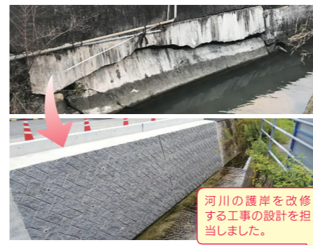
河川の護岸を改修する工事の設計を担当しました。