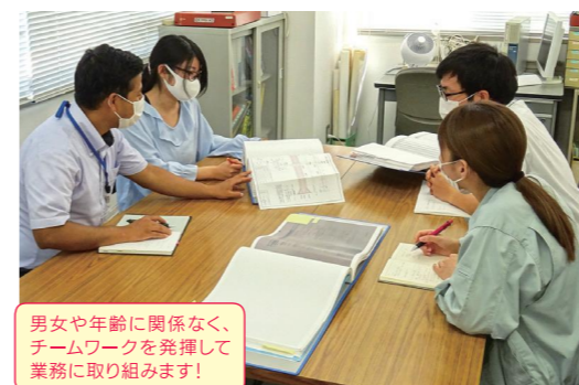
男女や年齢に関係なく、チームワークを発揮して業務に取り組みます!