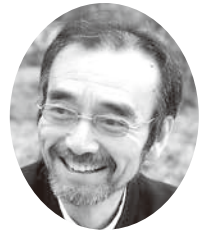
新井 満 (審査委員長)