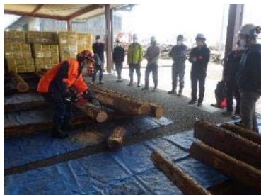
(事業2：研修の実施状況)

【実績】22人の応募者により、苗木の植栽方法、チェーンソーや刈払機等の安全講習等を実施