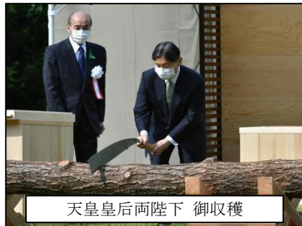
天皇皇后両陛下 御収穫