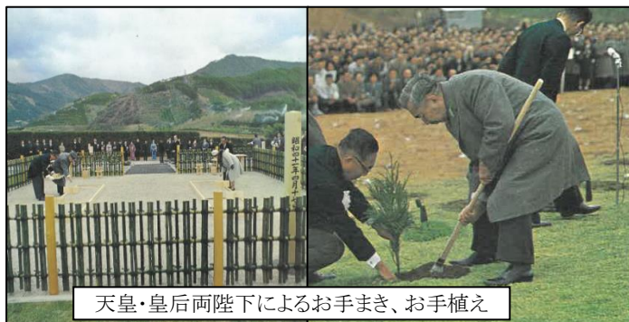
天皇・皇后両陛下によるお手まき、お手植え