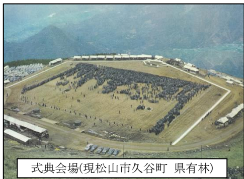
式典会場(現松山市久谷町 県有林)