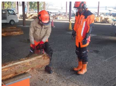
(事業2：研修の実施状況)

【実績】30人の応募者により、苗木の植栽方法やチェーンソー・刈払機等の安全講習等を実施