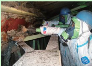
吹付け石綿の除去作業の様子