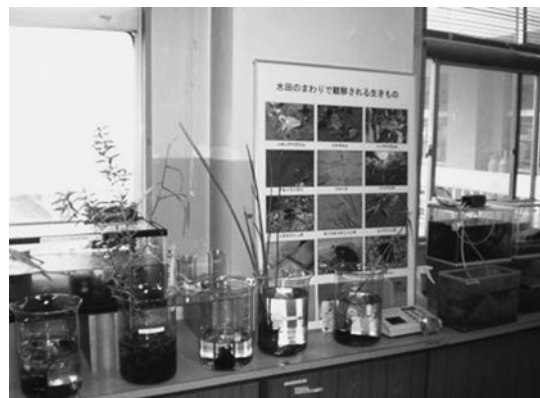
【生物多様性センター】