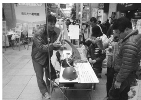
【生物多様性地域セミナーin愛媛】