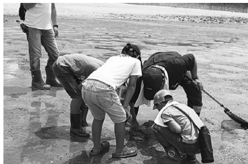
【城山や干潟における自然観察会】