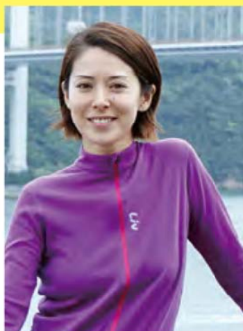
◇花楓(ファッションモデル)