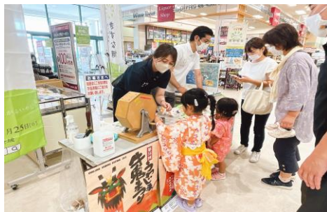
宇和島市との観光PRイベント風景