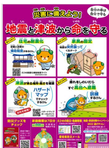
愛媛県作成ポスター