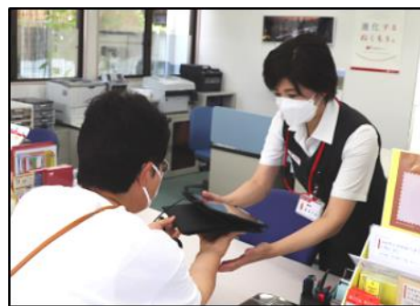
タブレットお渡し