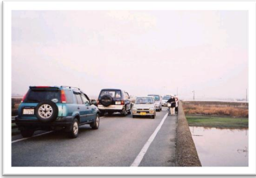
新兵衛橋の通行状況