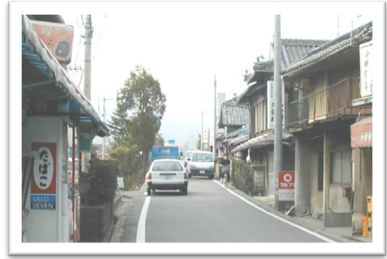
中山川の堤防道路の通行状況