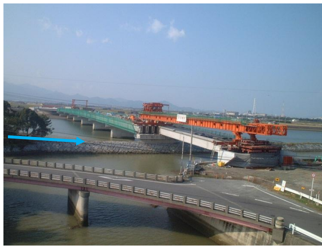
西条市内側から望む（手前は現道）