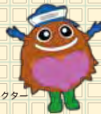
西条市 カブトガニ イメージキャラクター カブちゃん

西日本最高峰「石鎚山」の麓。日本一に輝いた名水「うちぬき」が市内各地で湧き出る。全国1位の生産量を誇る裸麦をはじめ、愛宕柿・七草など、多くの農作物や果樹に恵まれている食の宝庫。