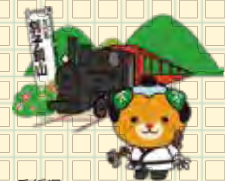
愛媛県 イメージアップキャラクター みきゃん