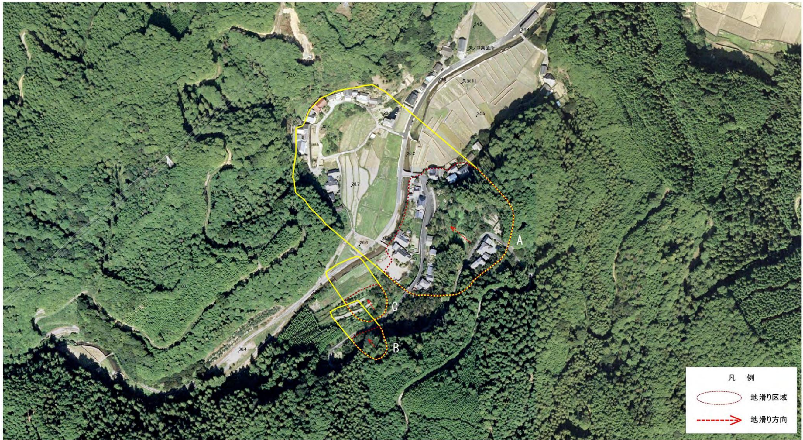
様式-2(地) 土砂災害警戒区域・土砂災害特別警戒区域 区域図