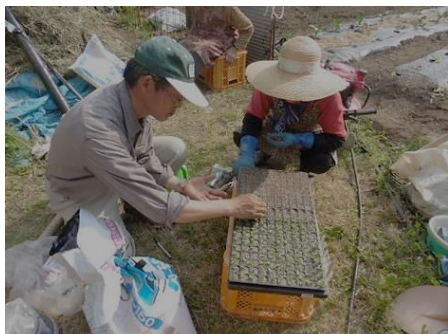
講習会で播種方法を実演

◆ 主な成果 栽培者は62名、延べ栽培面積は27aとなり、6～11月の売上は557千円（約5,500袋）と28年度の約13倍となりました。