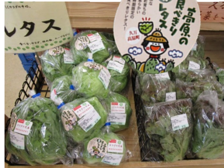
直売所での販売状況と専用シール