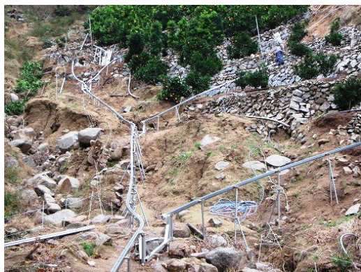
復旧したモノレール施設

主力かんきつである伊予柑の収穫開始を前に、地方局では 11 月 9 日に「モノレール復旧支援チーム」を設置し、J A と連携して 40 カ所余りの復旧支援と営農指導にあたりました。