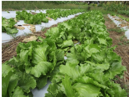
夏場でも順調に生育