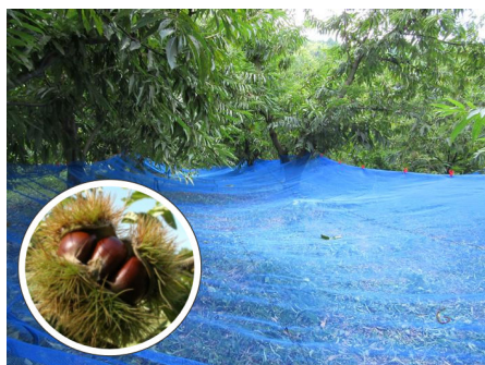
収穫ネットによる省力化の実証