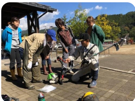
刈払機の安全利用講習

夫婦で一緒に就農する方が増加していることから、女性の経営参画をスムーズに進めるため農業機械の利用や女性目線でのPR活動など様々な支援を展開しています。