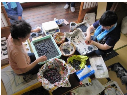
ブルーベリーの選別・調整作業

◆ 主な成果 これまでブルーベリー選別、伊予柑収穫・運搬、タマネギ苗植付けなど13例の農作業支援を実施し、作業を細分化することで福祉事業所の利用者が農作業の担い手となれることが確認できました。