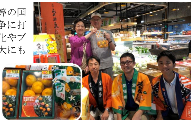
台湾の高級スーパーでの販促

30 年産の温室みかん約 3.6 t を昨年 9 月に輸出し、中秋節に合わせたプロモーションを行うことで、海外における愛媛かんきつのブランド定着に取り組ましました。