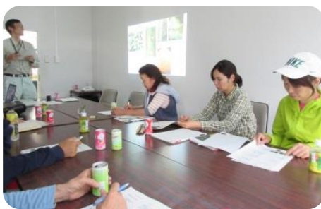
環境にやさしい病虫害防除法について研修 (中島農業女子会)