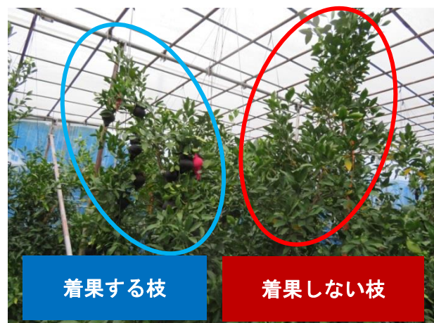
隔年結果防止のための大枝別交互結実試験