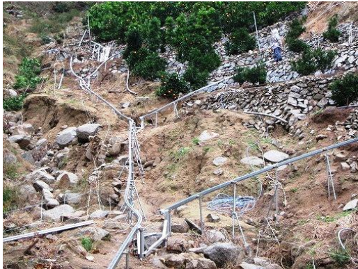
復旧したモノレール施設

主力かんきつである伊予柑の収穫開始を前に、地方局では 11 月 9 日に「モノレール復旧支援チーム」を設置し、J A と連携して 40 カ所余りの復旧支援と営農指導にあたりました。