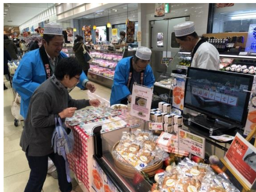
松前町の大型商業施設での試食販売イベント

昨年 12 月に実施したサーモン加工品の試食販売イベントでは、用意した伊予柑風味の干物、パエリアの素をはじめ全ての商品が完売するなど大変好評で、高齢化や人口減少が進む離島の新たな産業資源として、地元の活性化に繋がることが期待されています。