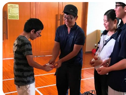
豪雨災害の被災地（大洲）にトマトジュースを寄贈する夫婦