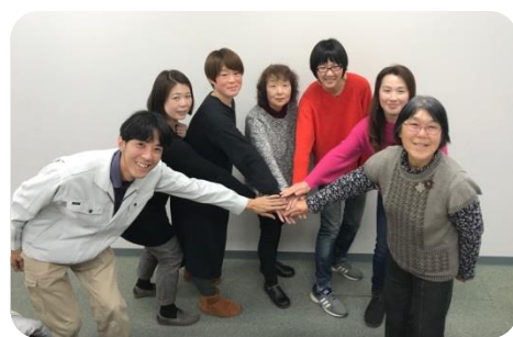
力をあわせて東温の農業を支えます！ (東温農業女子会)