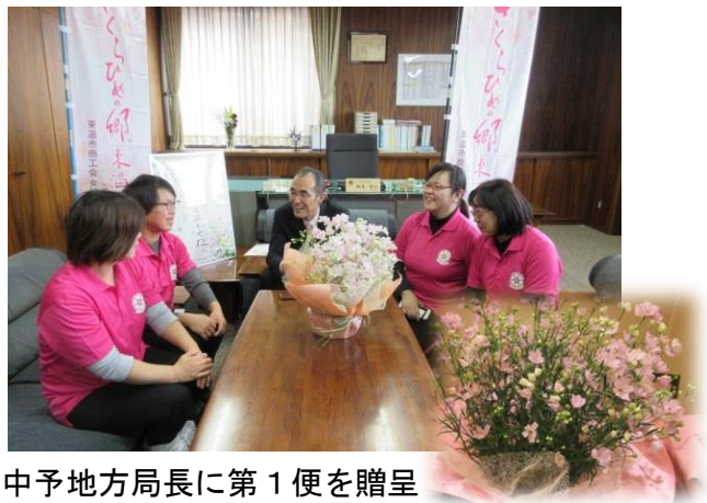
中予地方局長に第 1 便を贈呈

利用者からは大好評で、地方局としても本県オリジナルの特産花きとして生産拡大を図るとともに、さくらひめのブランド化を進めてまいります。