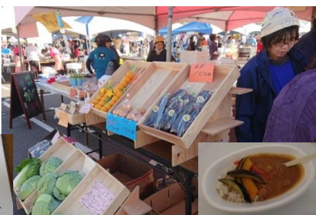
松前町内のイベントで農産物や「はだか麦カレー」を販売