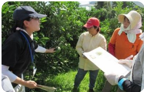
伊予柑の摘果講習 (興居島農業女子会)

3地域で農業女子会を立ち上げ、若手女性農業者を対象に栽培技術や経営管理等の勉強会を実施しています。