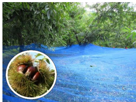
収穫ネットによる省力化の実証