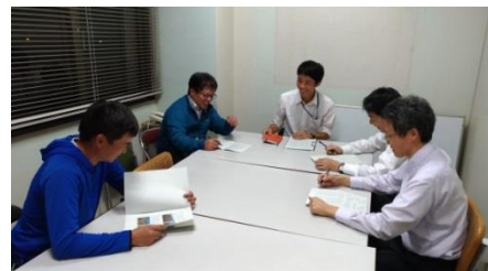
定期的にJAや地方局などの担当者が集まり、農福連携の推進策を協議