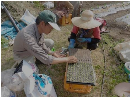
講習会で播種方法を実演

◆ 主な成果 栽培者は62名、延べ栽培面積は27aとなり、6～11月の売上は557千円（約5,500袋）と28年度の約13倍となりました。