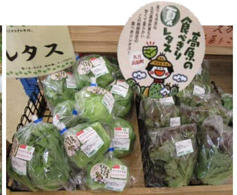
直売所での販売状況と専用シール