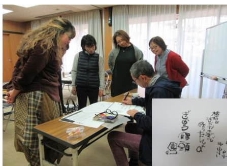
プロのデザイナーを講師に農産物のポップづくり

就農もない若い女性農業者や認定農業者のパートナーを対象とした研修会や交流活動の実施を通じて女性が活躍できる環境づくりを進めています。