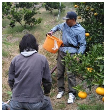
施設利用者に急傾斜地で伊予柑の運搬方法を指導