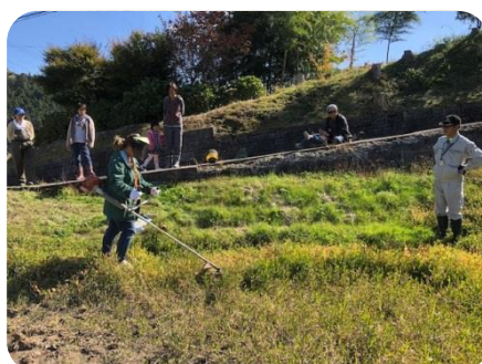
実際に刈払機を使って水田畦畔の草刈りを実施