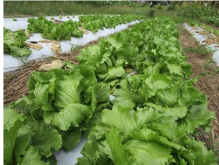
夏場でも順調に生育