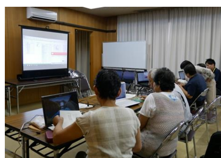
表計算ソフトを使って販売管理や経営分析に挑戦！