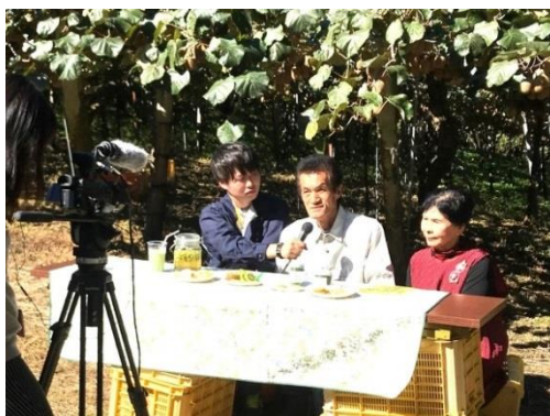
撮影の様子 (キウイフルーツ・中山)