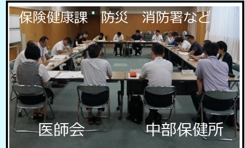
＜臼杵市医師会などとの会議風景＞ テーマ：「大規模災害時の活用方法」 大分県中部保健所、消防署、福祉、 防災、電算担当も出席。