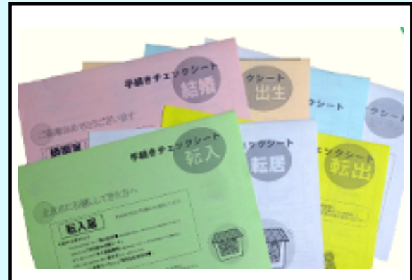
7種類のライフイベントにに応じて必要な手続きをご案内