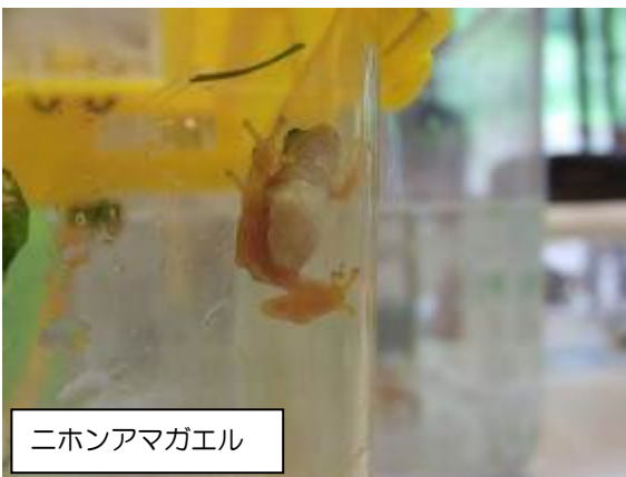
ニホンアマガエル