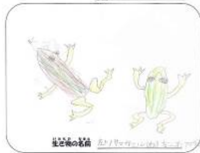
生き物の名前 ヒナバタ

カエルも見たけど、カエルの中には いろいろな種類があった。大川の田んぼには いろいろな種類を見つけた。愛媛大学 のかみさん、又石原原先生と一緒で 上野原と山崎の中間にはいろいろな動物が たくさんいる。そして、美川には たくさんいる。そして、美川には たくさんいる。