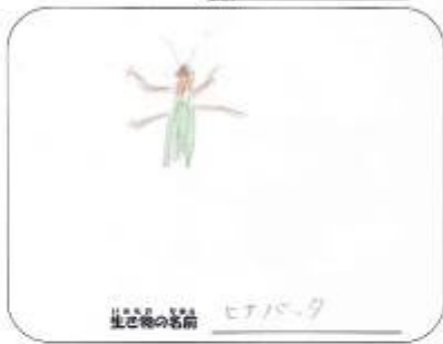
生き物の名前 ヒナバタ

バードにもオセルにもいろいろな種類が あることがわかった。5000種類以上の 生物がいることがわかりました。 ヒナバタは、つるつるのものが、かべを つるつるに、かべを、かべを、かべを 美川には、かべを、かべを、かべを、かべを すこい、かべを、かべを、かべを、かべを 大川に、かべを、かべを、かべを、かべを