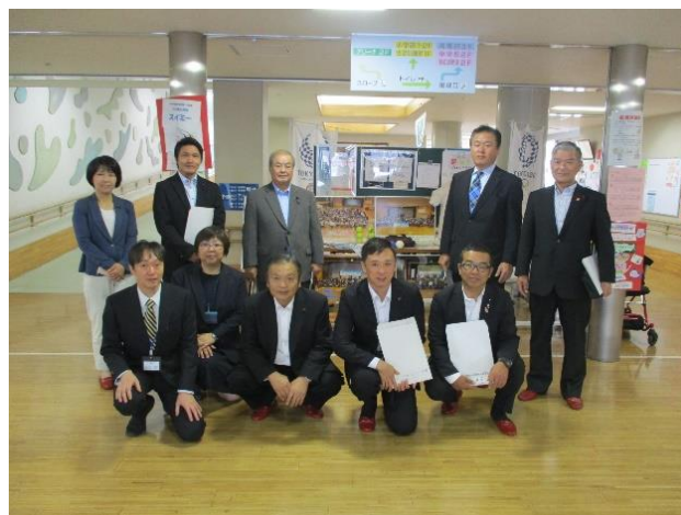
東京都立小平特別支援学校 （東京都小平市）