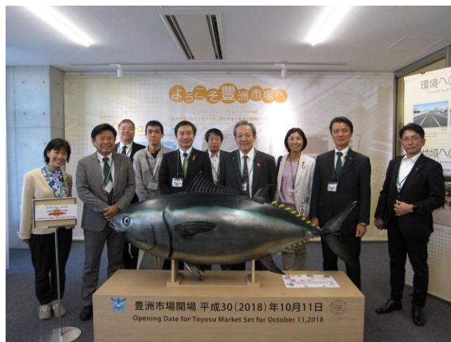
東京都中央卸売市場豊洲市場 （東京都江東区）