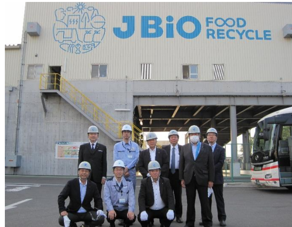
株式会社 J バイオフードリサイクル (神奈川県横浜市)