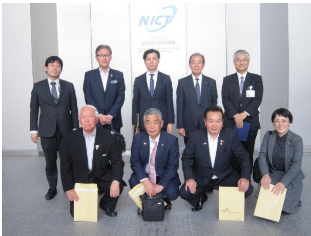
情報通信研究機構 （東京都小金井市）