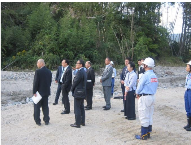
筑後川水系赤谷川 (福岡県朝倉市)