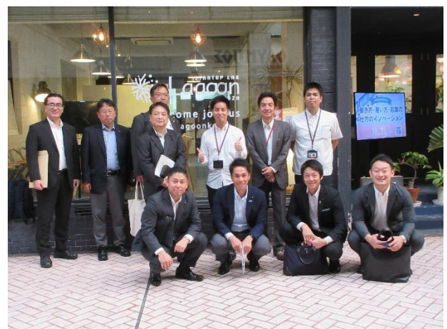
スタートアップ ラボ ラグーン (沖縄県沖縄市)