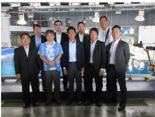
一般財団法人 沖縄美ら島財団 (沖縄県国頭郡本部町)