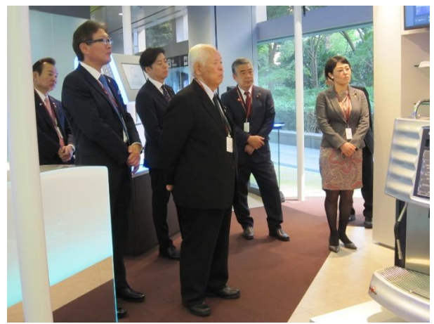
日本電気株式会社 （東京都港区）