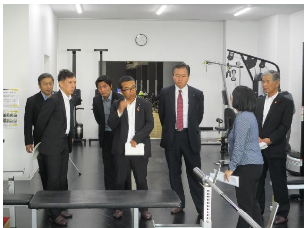
日本財団パラアリーナ （東京都品川区）