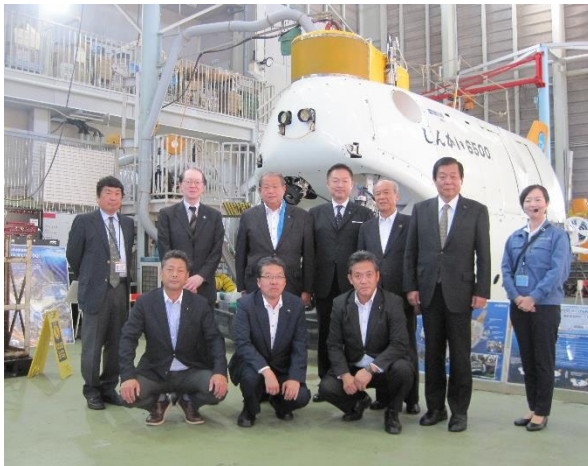
国立研究開発法人海洋研究開発機構 (神奈川県横須賀市)