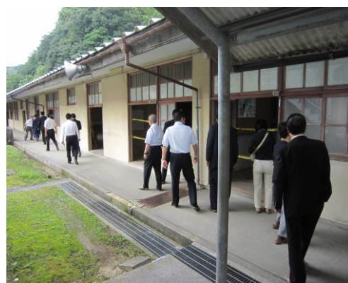
吉田中学校 (宇和島市)