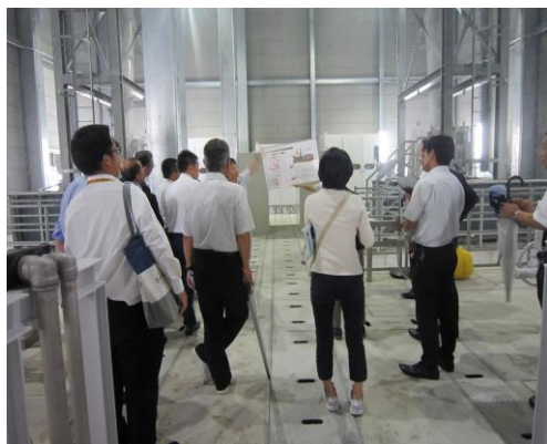
鹿野川ダム (大洲市)