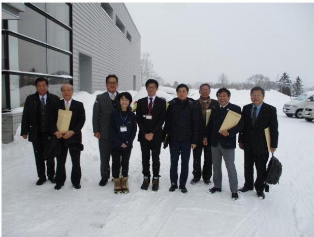
株式会社ニセコリゾート観光協会 (北海道虻田郡ニセコ町)