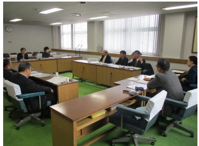
北海道庁 (北海道札幌市)