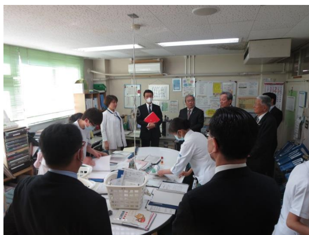
久里浜医療センター (神奈川県横須賀市)