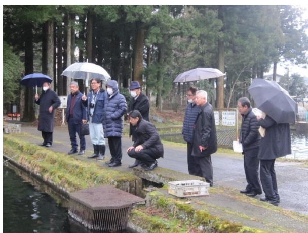
静岡県水産技術研究所富士養鱒場 （静岡県富士宮市）