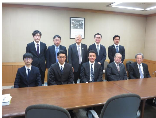
原子力規制委員会 (東京都千代田区)