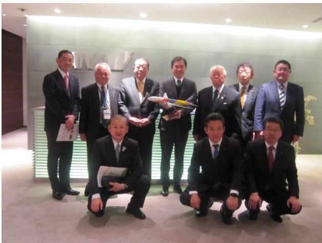
株式会社ANA総合研究所 (東京都港区)