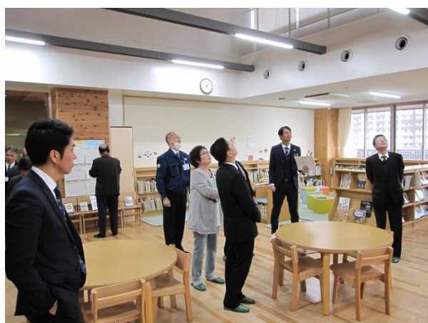
江東区立有明西学園 （東京都江東区）