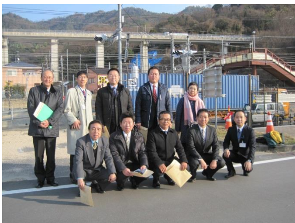
一般国道 31 号 (広島県安芸郡坂町)