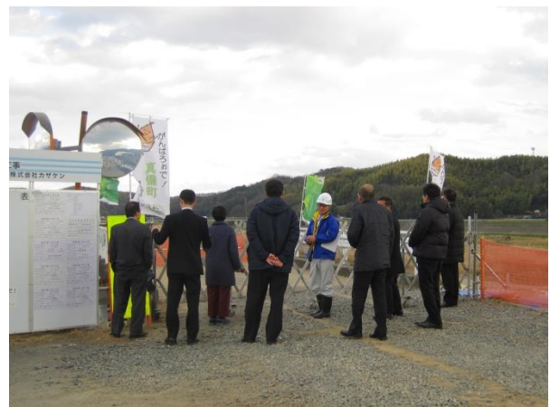
高梁川水系小田川 (岡山県倉敷市真備町)