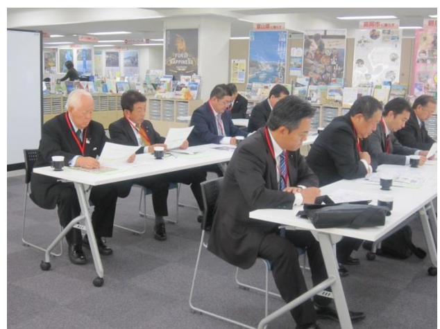
認定NPO法人ふるさと回帰支援センター (東京都千代田区)