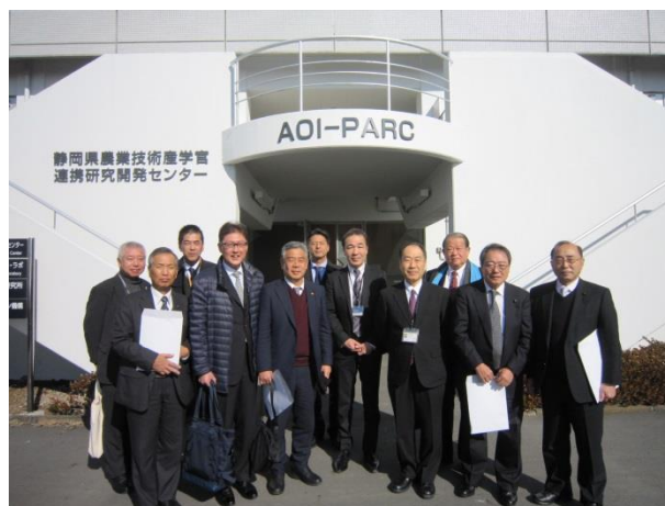
（一財）アグリオープンイノベーション機構 〔AOI-PARC〕 （静岡県沼津市）