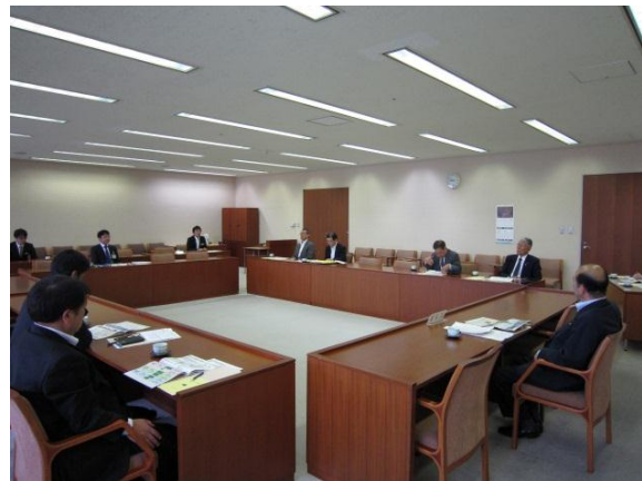
宮城県庁 （宮城県仙台市）