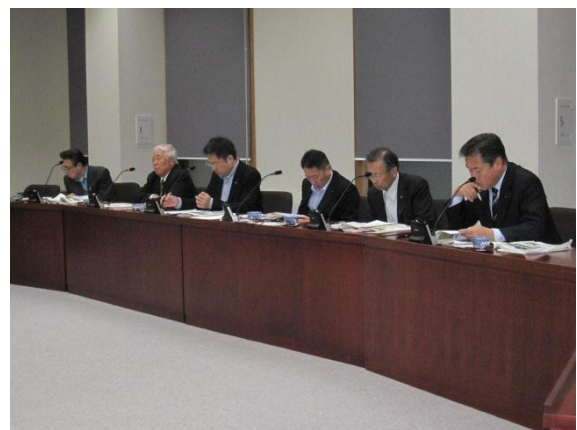
秋田県庁 （秋田県秋田市）