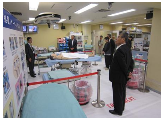
放射線医学総合研究所 （千葉県千葉市）