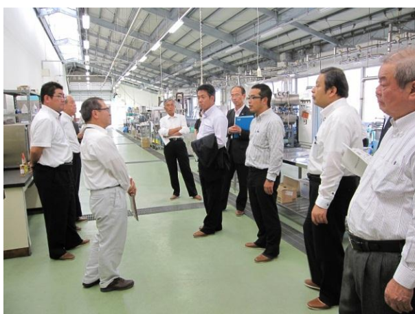
鹿児島県農産物加工研究指導センター （鹿児島県南さつま市）