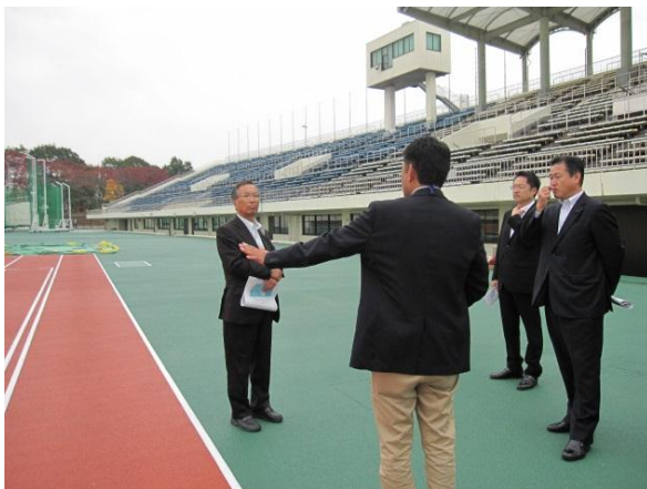
北上総合運動公園 （岩手県北上市）