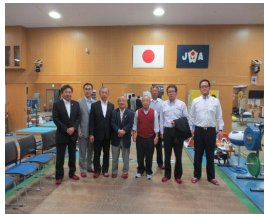
味の素ナショナルトレーニングセンター (東京都北区)