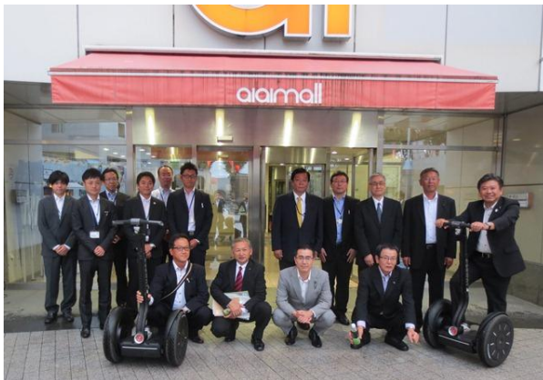
筑波研究学園都市 (茨城県つくば市)