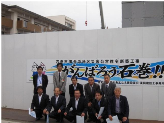
黄金浜地区災害公営住宅 （宮城県石巻市）