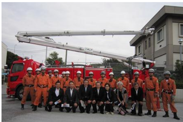
東京消防庁第二消防方面本部 （東京都大田区）