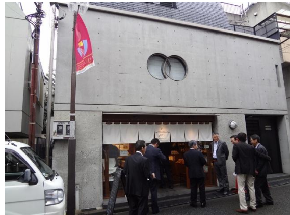
EHIMADE 下北沢店 (東京都世田谷区)