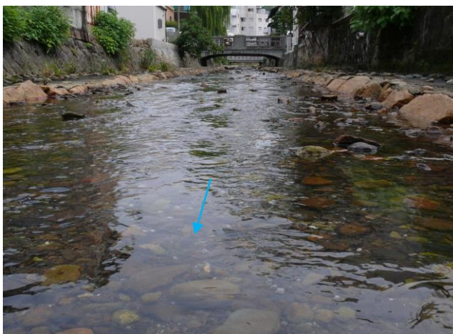
辰野川の澄んだ流水