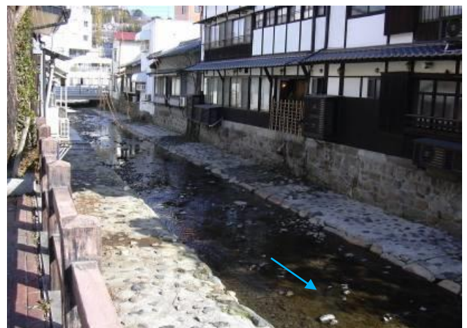
市街地を流れる辰野川(下流)