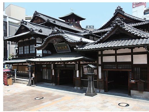
どうご おんせんほんかん 道後温泉本館