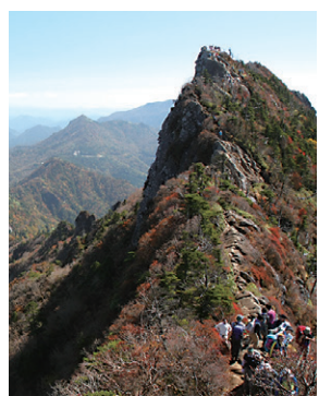
いしづみさん 石鎚山