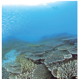
うわかい 宇和海のサンゴ