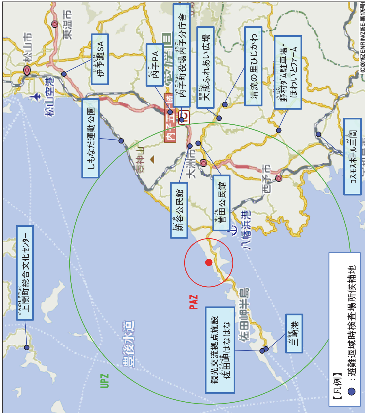
図は伊方地域の緊急時対応から抜粋

※2:伊方町は、PAZ及び予防避難エリアに位置するが、放射性物質放出後に避難を実施した住民は、当該検査の対象