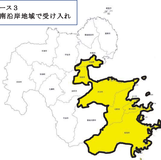
ケース3 県南沿岸地域で受け入れ