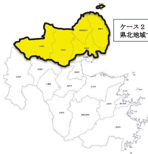
ケース2 県北地域で受け入れる