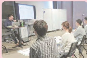
▲障がい当事者からの講話。「スロープがあっても、長すぎると腕が疲れて上りづらいというお話は印象的でした」とPOPの皆さん