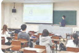
▲松山大学での活動の様子

「あいサポーター研修」で障がいのある方のお話を聞いたことは、とても貴重な経験に。障がいのある方がどんなことで困っているのか、これまでの知識のインプットでは想像できなかったことを知り、実際に体験してみることやお話を聴くことの大切さを学びました。今後は、車いす体験や色弱体験、地域のボランティア活動に参加するなどして、実際に「経験すること」に力を入れたいと考えています。また、研修でいただいた「あいサポートバッジ」を胸に、私たちのちょっとした手助けや配慮が誰もが暮らしやすい温かな社会づくりの力になると意識し、自分たちにできることを実践していこうと思います。