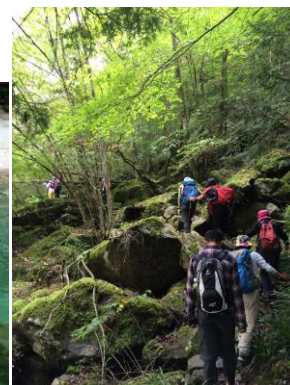
【エコツアー（面河古道ツアー）】