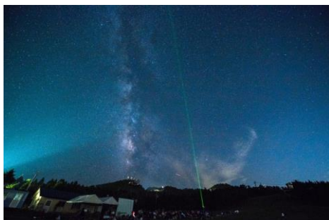
【エコツアー（星空観察）】