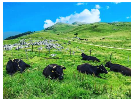
【四国カルスト県立自然公園】