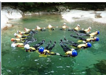
【エコツアー（面河溪谷キャニオニング）】