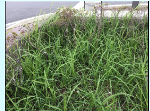
元々雑草がおいしげった場所

また、職員間のコミュニケーションがスムーズになったことで、通常業務でも協力ができるようになったほか、熊本市で開催誘致を検討している全国都市緑化フェアのモデル的取組として庁内でも評価され、職員のモチベーションの向上にも繋がった。