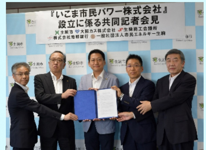
設立記者会見写真