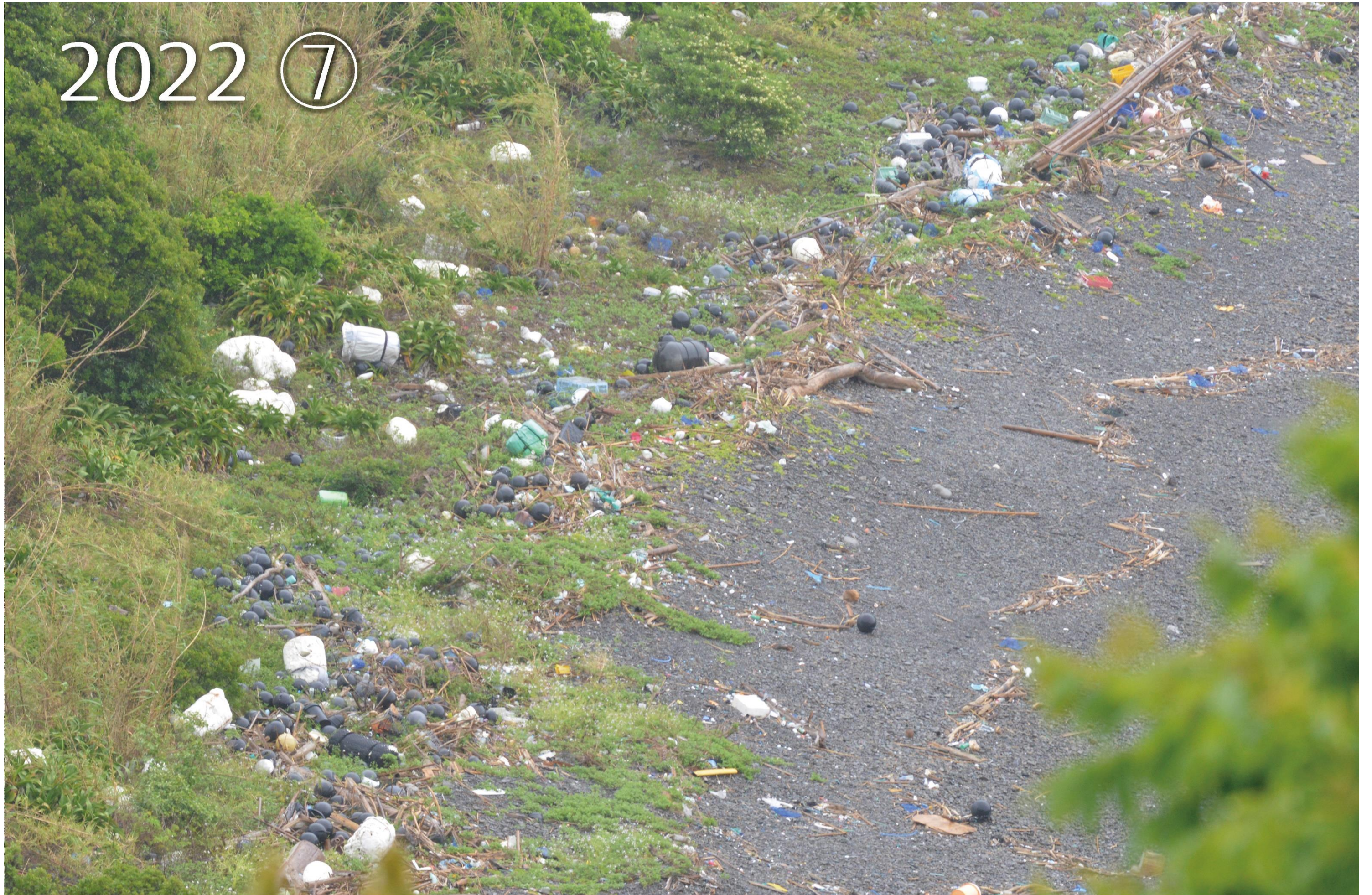
愛南町由良半島南側 太平洋からの大波で海岸の後方まで打ち上げられた漂着ごみ。砂に埋もれた大量の漂着ごみがあった。