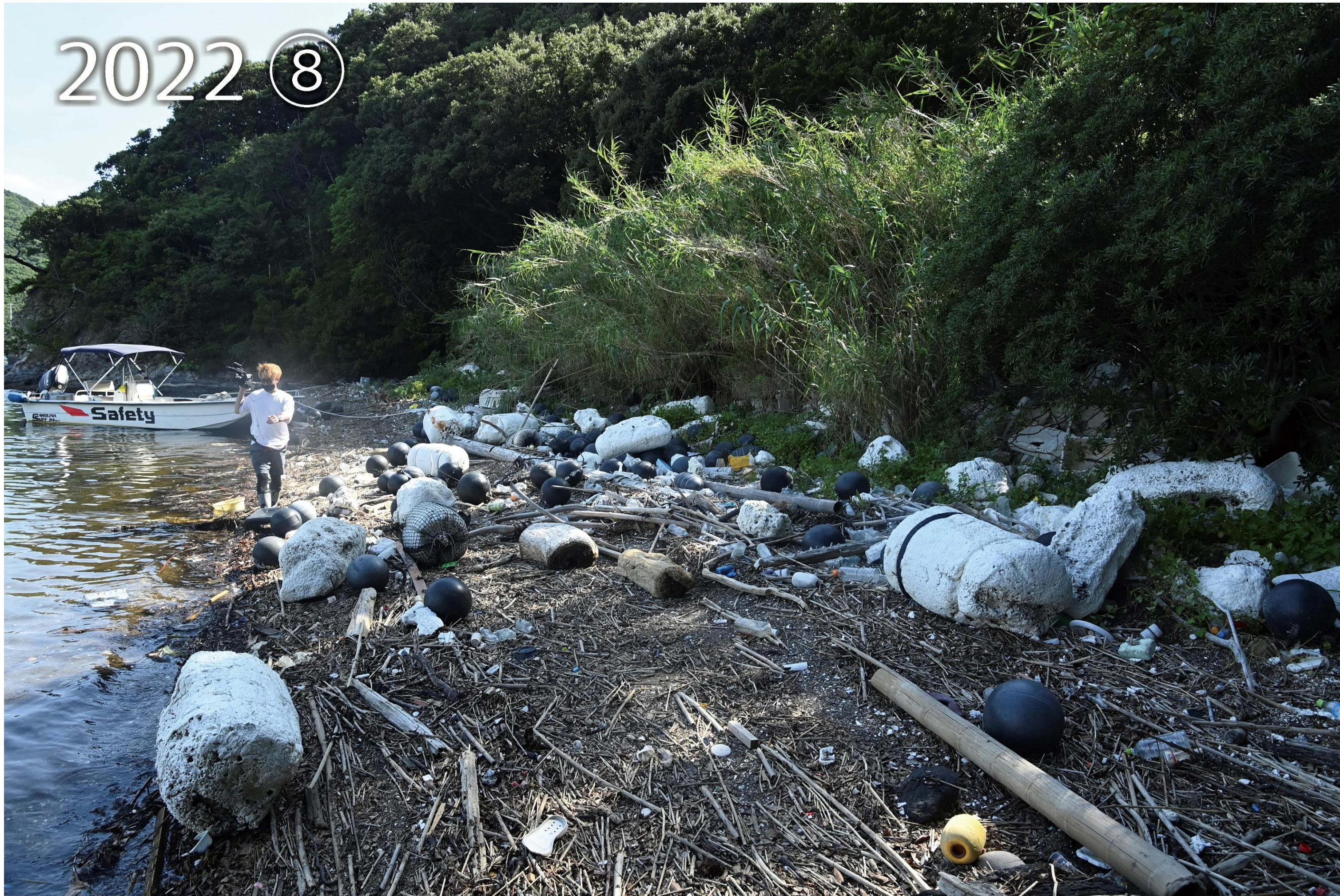
愛南町御荘湾 ボランティア団体が活動する前の調査写真、漂着ごみが大量に集まっていた。