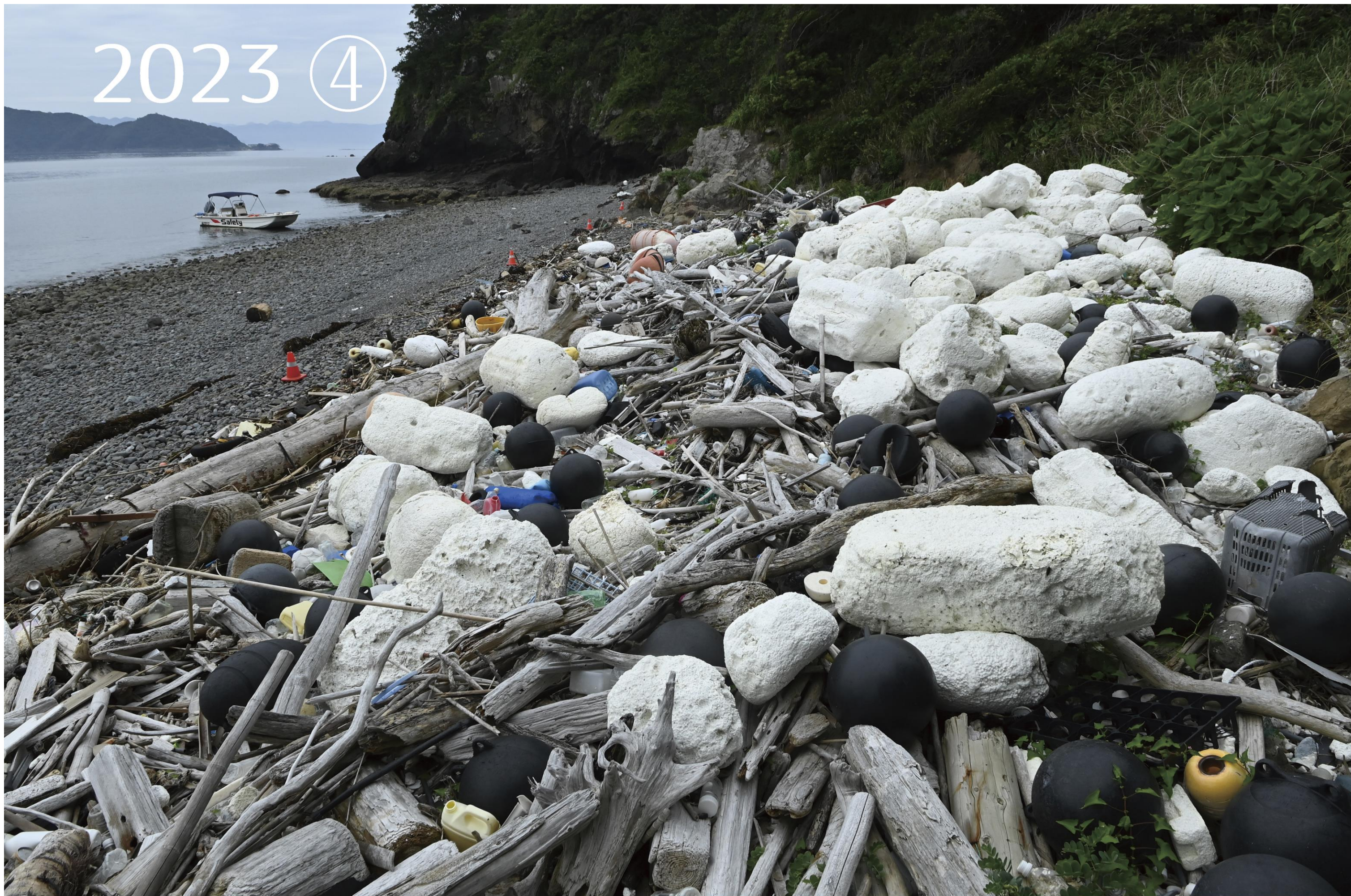
宇和島市戸島 近年では清掃活動が行われた形跡がない場所であり、大量の漂着ごみがある。