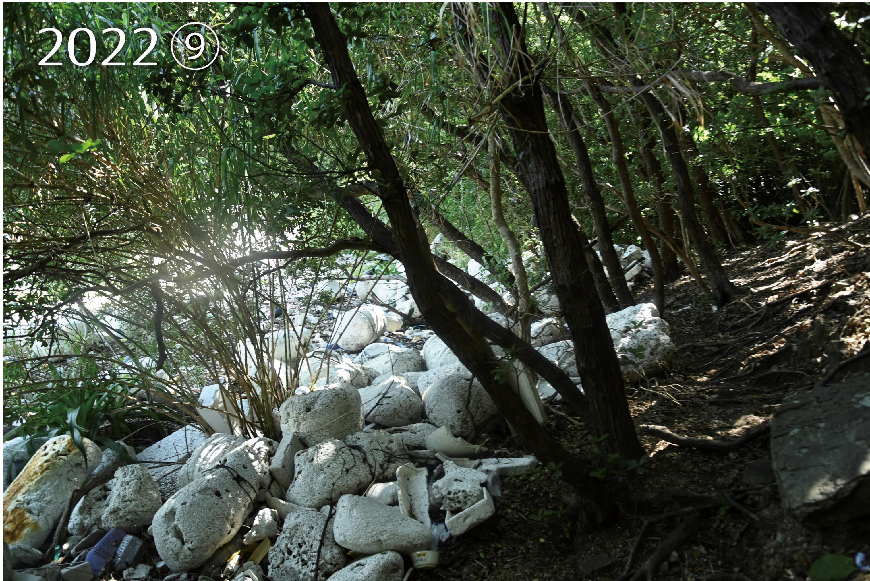
愛南町御荘湾 ボランティア団体が活動する前の調査写真、漂着ごみが大量に集まっていた。