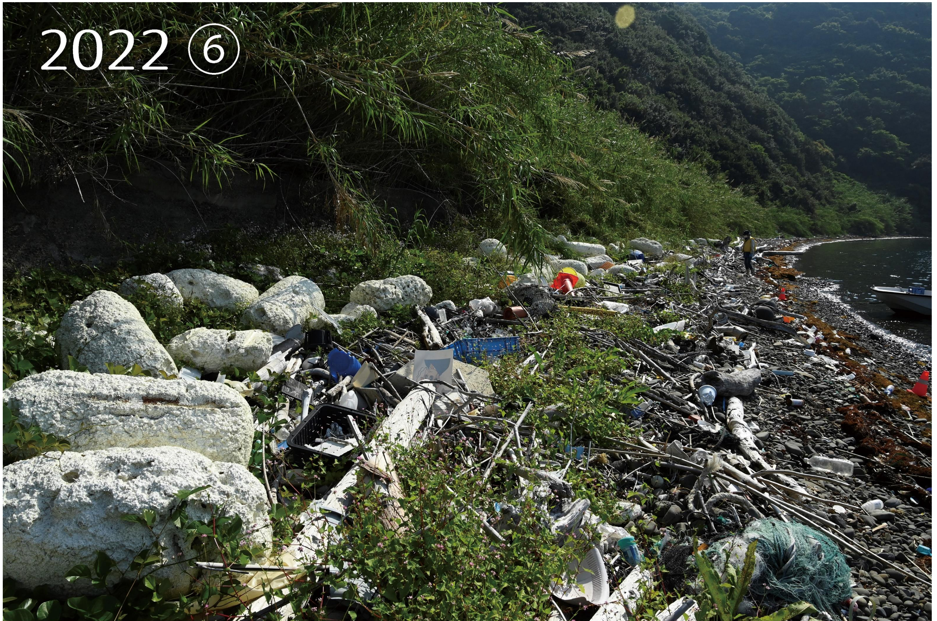
宇和島市三浦半島南側 ボランティア団体が活動する前の調査写真、漂着ごみが大量に集まっていた。