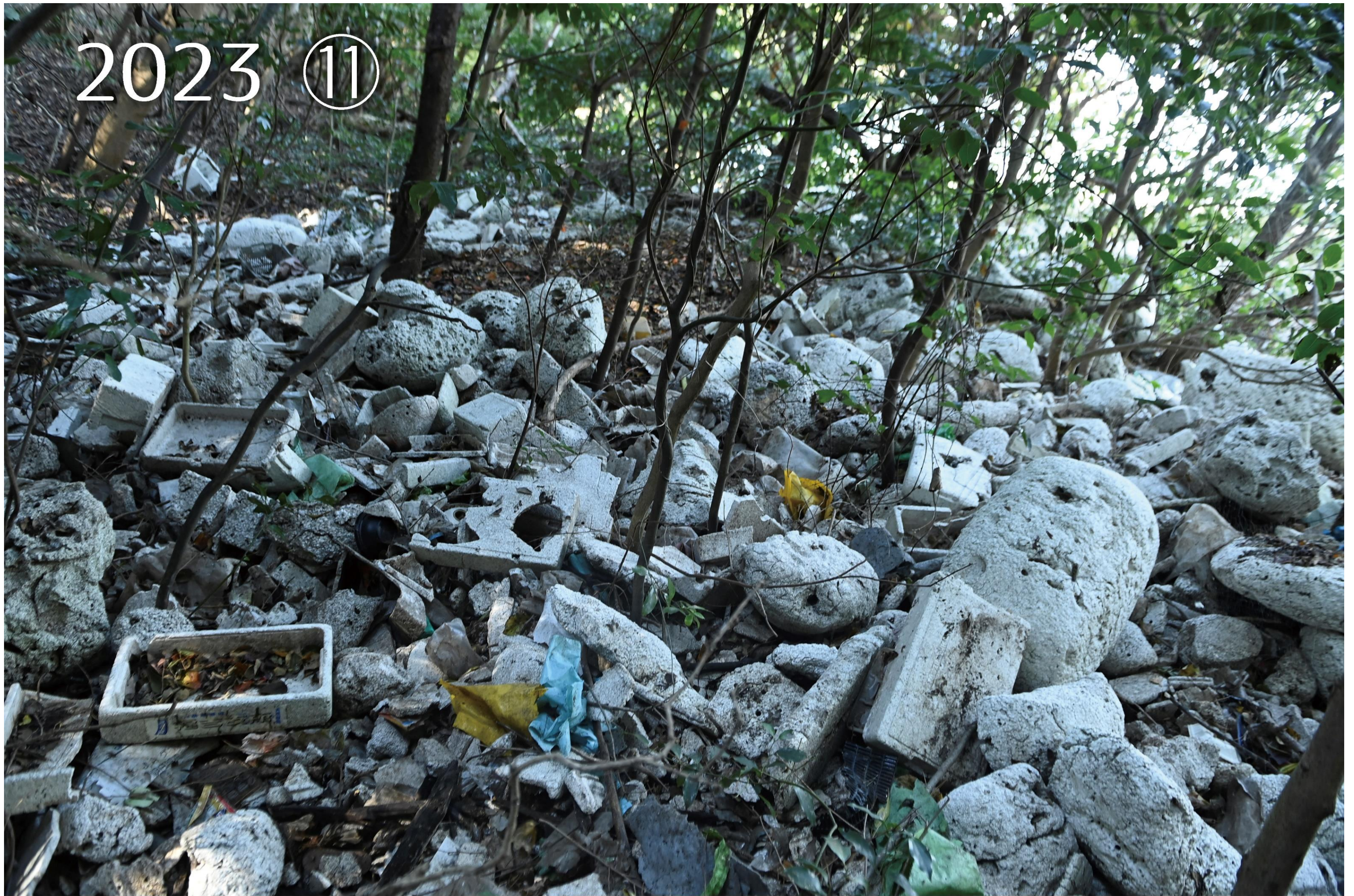
松山市津和地島 正面が広島県を向いている海岸。漂着ごみは対岸から漂流してくる。