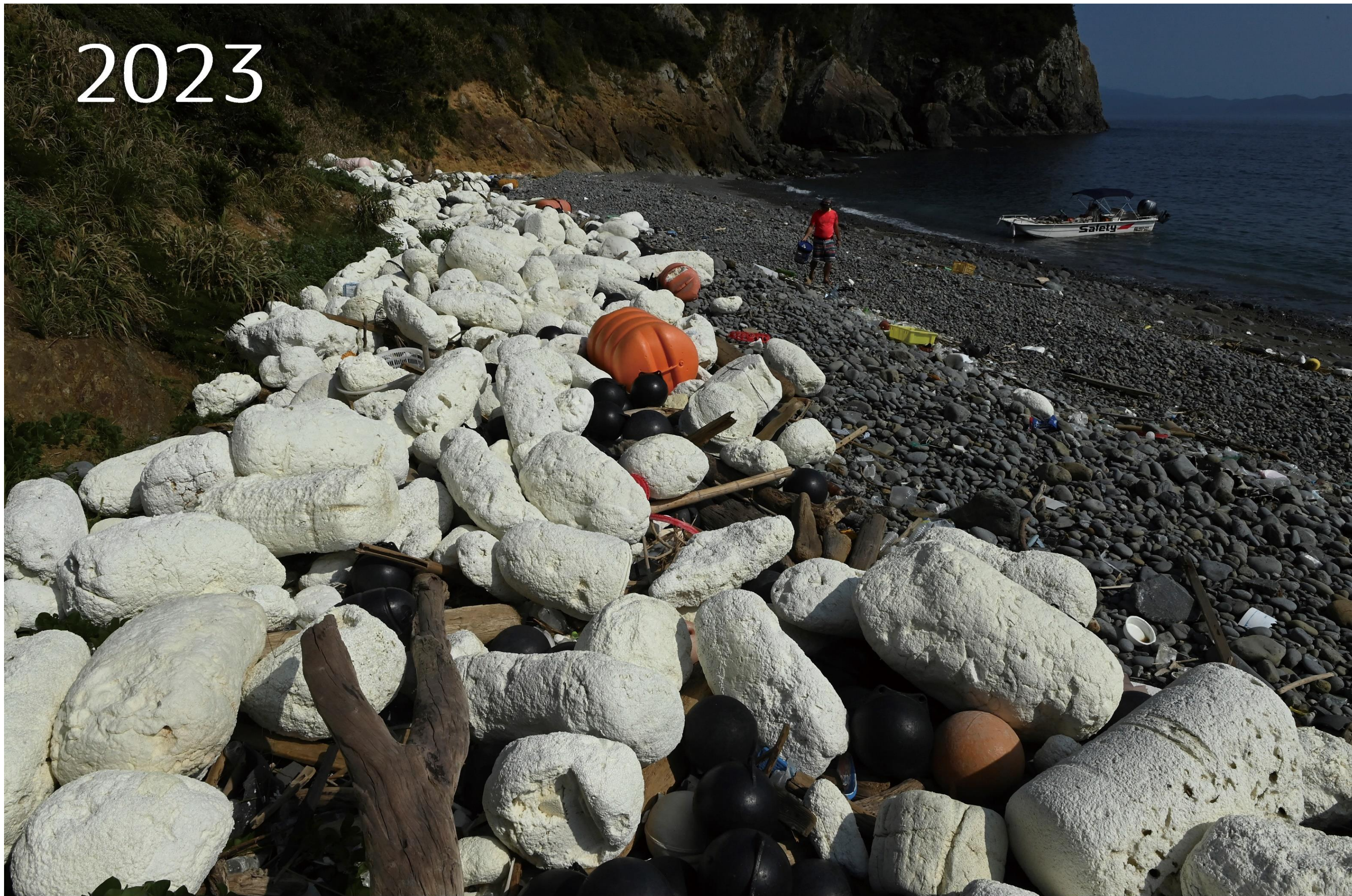
宇和島市横島 危険な海岸なので継続調査場所にはしていないが、瀬戸内海で最も発泡スチロールの多い海岸の一つ。