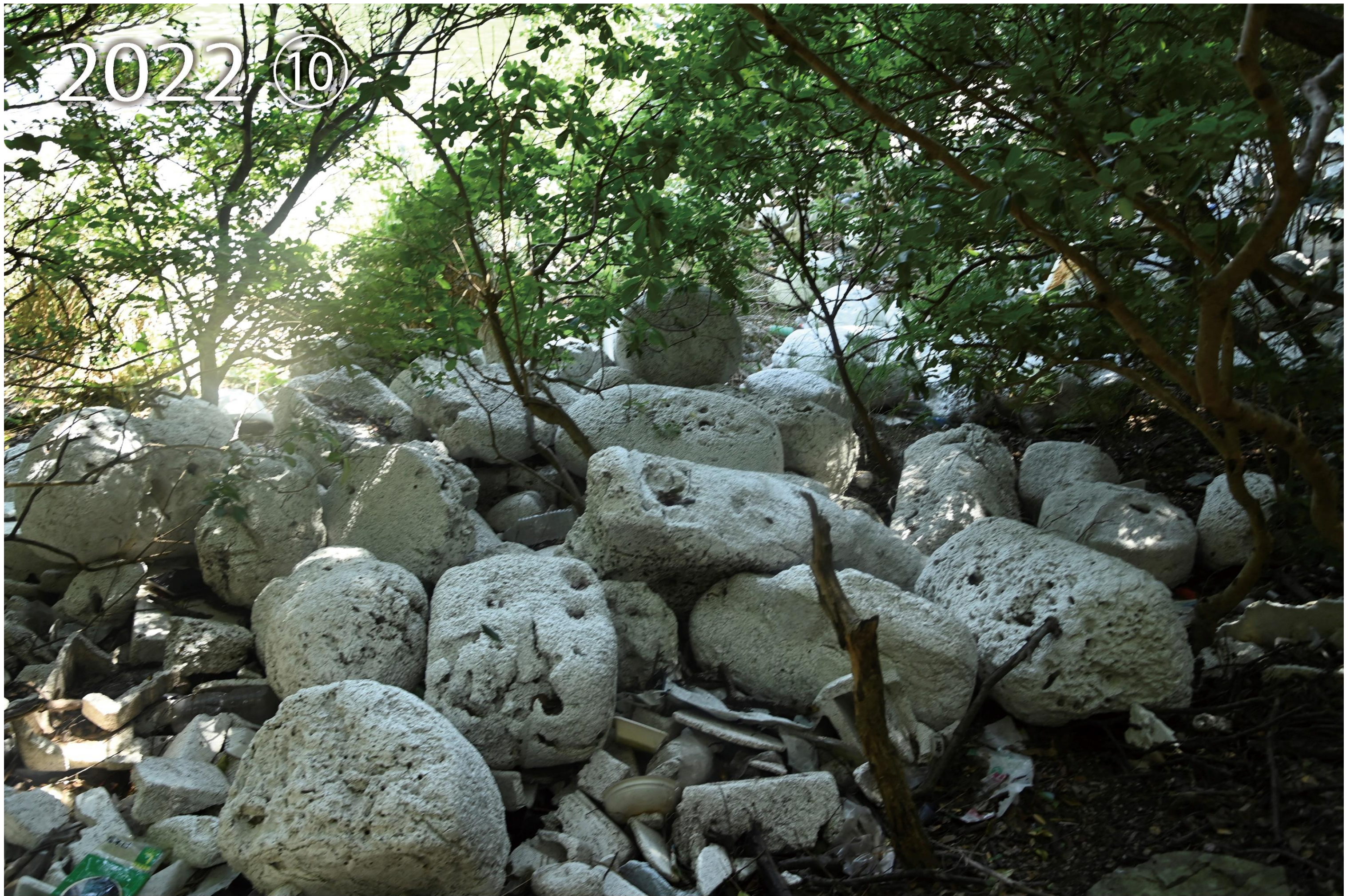
愛南町御荘湾 ボランティア団体が活動する前の調査写真、漂着ごみが大量に集まっていた。