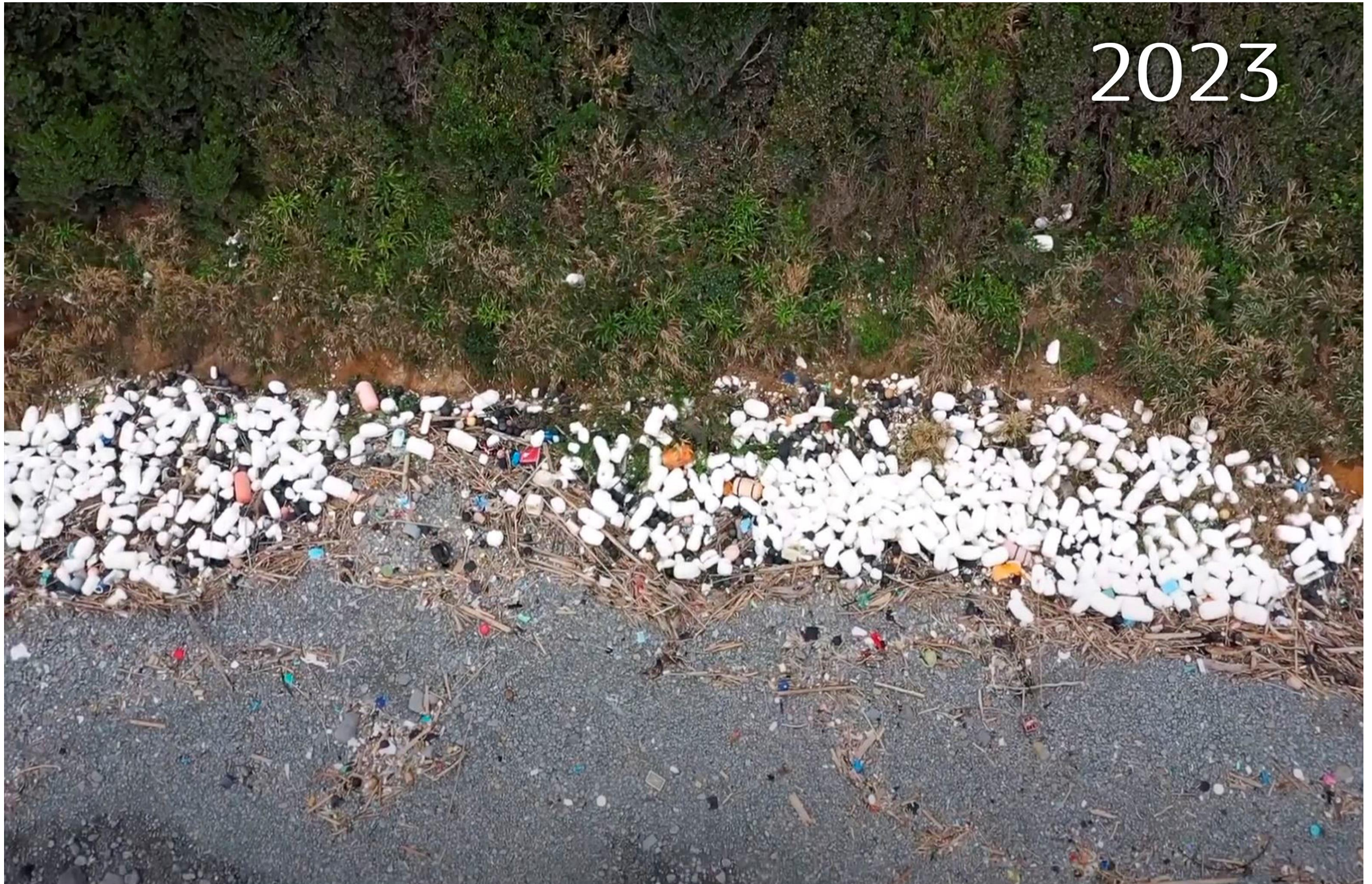
92 宇和島市横島（撮影：ドローン） 大量の発泡スチロールが漂着。発泡スチロールの劣化で、大量のマイクロプラスチックの発生が懸念される。