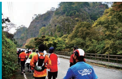
礫岩峰が連なる古岩屋荘前の風景

直瀬川の流れによって深く削られてできた礫岩峰と呼ばれる峰々が緑の森から突き出す、国の名勝・古岩屋。そこから、空海や一遍が修行に訪れた四国霊場第46番札所岩屋寺を結ぶ遍路道は、スピリチュアルな雰囲気が漂う癒やしのエリアです。心静かに散策を楽しめる森林浴コースで、日々のストレスを吹き飛ばしましょう！