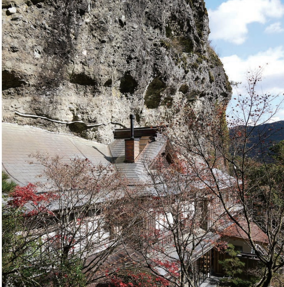
奇岩絶壁と一体化した岩屋寺